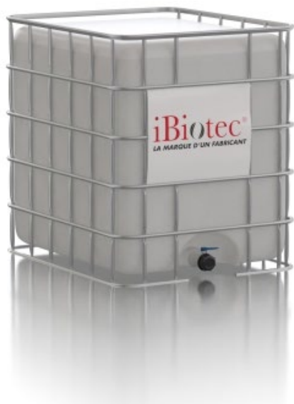
Container GRV 1000 L

NEUTRALENE AL 30 code article 515593 fiche de données de sécurité 160851