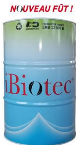
Fût 200 L

EMBALLAGE EN ACIER 100 % RECYCLABLE RÉCUPÉRABLE, RÉNOVABLE