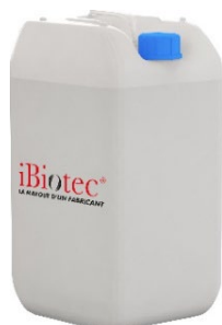
Bidon 20 L

NEUTRALENE AL 30 code article 514265 fiche de données de sécurité 160851 NEUTRALENE AL 50 code article 516203 fiche de données de sécurité 160090 NEUTRALENE AL 66+ code article 516641 fiche de données de sécurité 161541