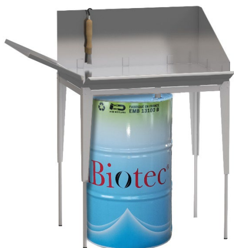
Fontaines à solvants