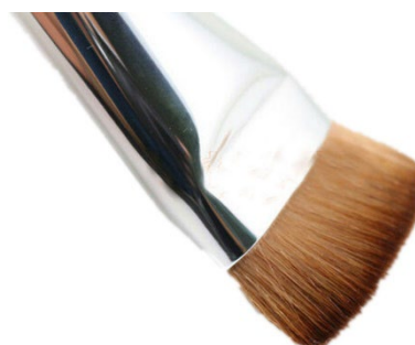
Dégraissage avec brosse